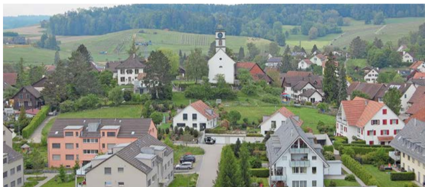
Die Gemeinde Henggart heute.