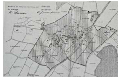
Henggart sowie der Zonenplan der Gemeinde von 1956.